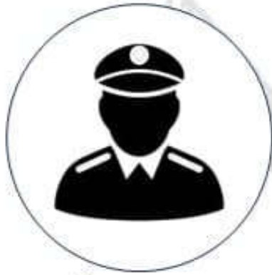
พนักงานสอบสวน